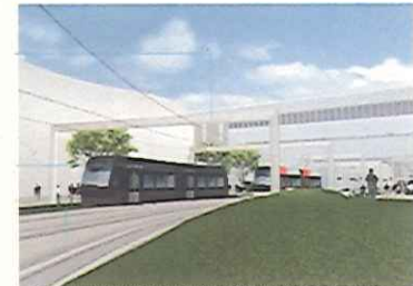
南北接続新線のイメージ