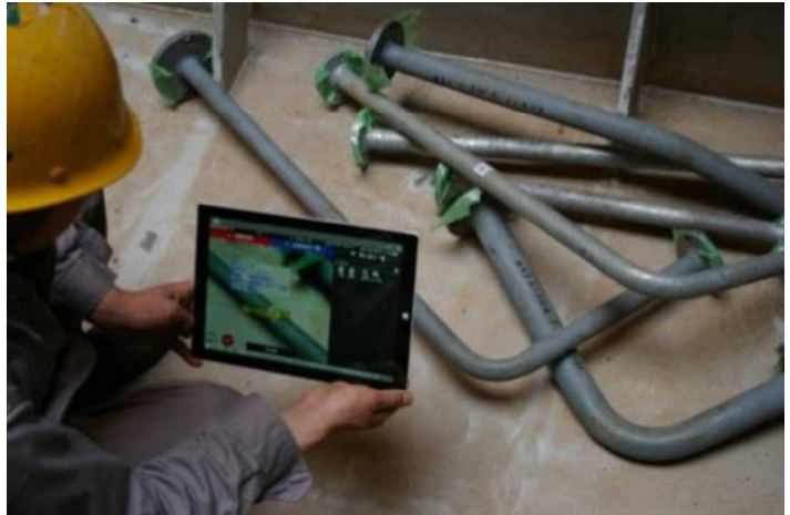
配管情報を確認している様子

また、画面上に重畳表示される、管ごとの作業状況入力画面から、配管取付けを行った技能者名、作業終了日時、設計者・管理者への申し送り情報を、作業を行った技能者自身が、その場で、大きな負担をかけることなく、入力できます。これにより、従来は事務所に戻ってから作成していた作業報告書作成などの業務負担を軽減できるとともに、情報伝達ミスを低減できます。