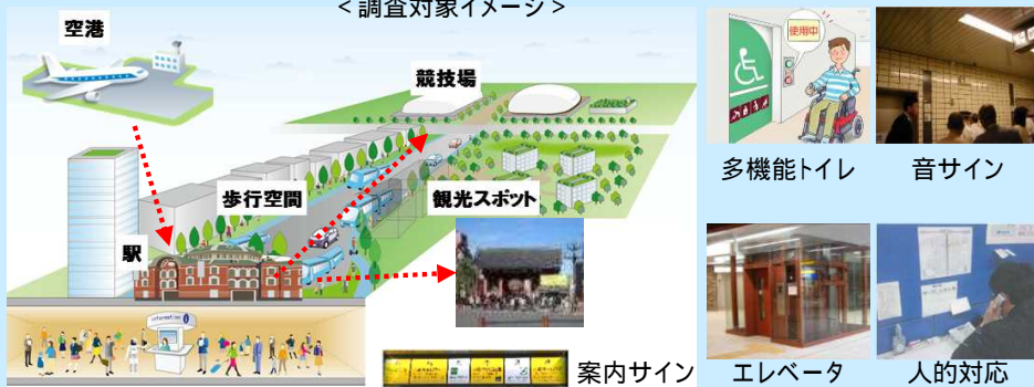
<調査対象イメージ>