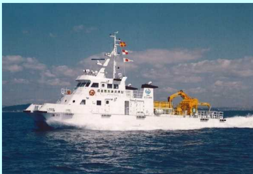
調査観測兼清掃船 海輝（かいき）