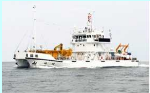
調査観測兼清掃船 海煌（かいこう）