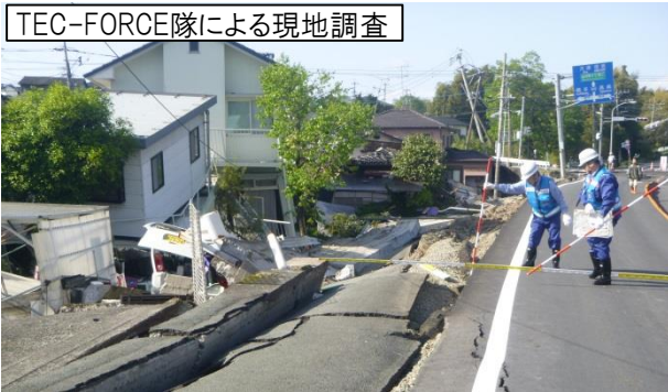
TEC-FORCE隊による現地調査