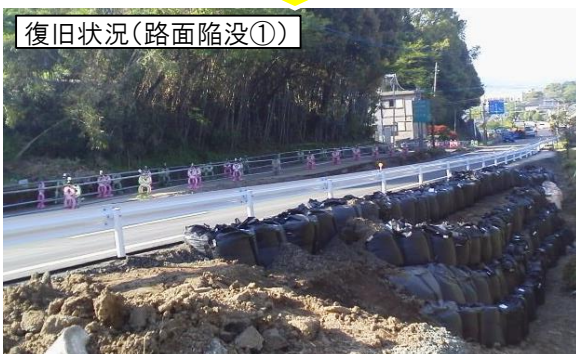
復旧状況(路面陥没①)