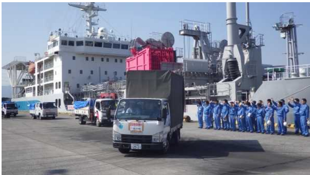
20日(水) 9:00 熊本県南阿蘇村へ輸送される支援物資