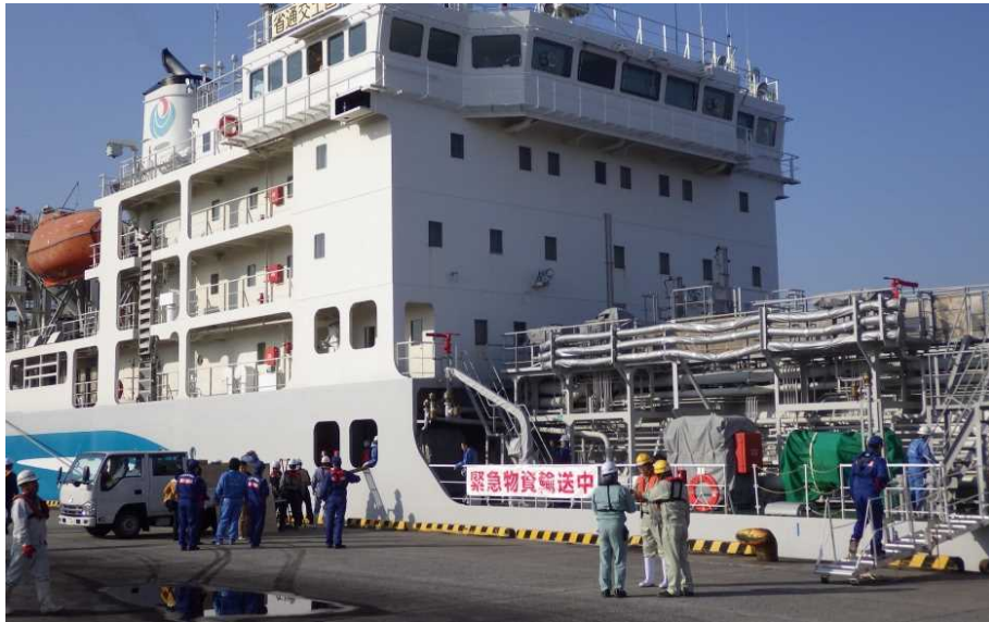
20日(水) 7:20 大分港大在地区水深10m岸壁に着岸