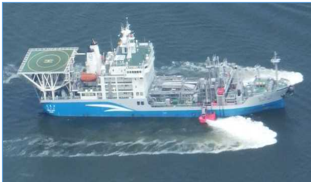
大型浚渫兼油回収船 清龍丸（せいりゅうまる） ＜中部地方整備局所管＞