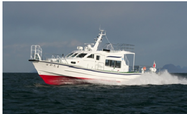
港湾業務艇 はやたま ＜近畿地方整備局所管＞