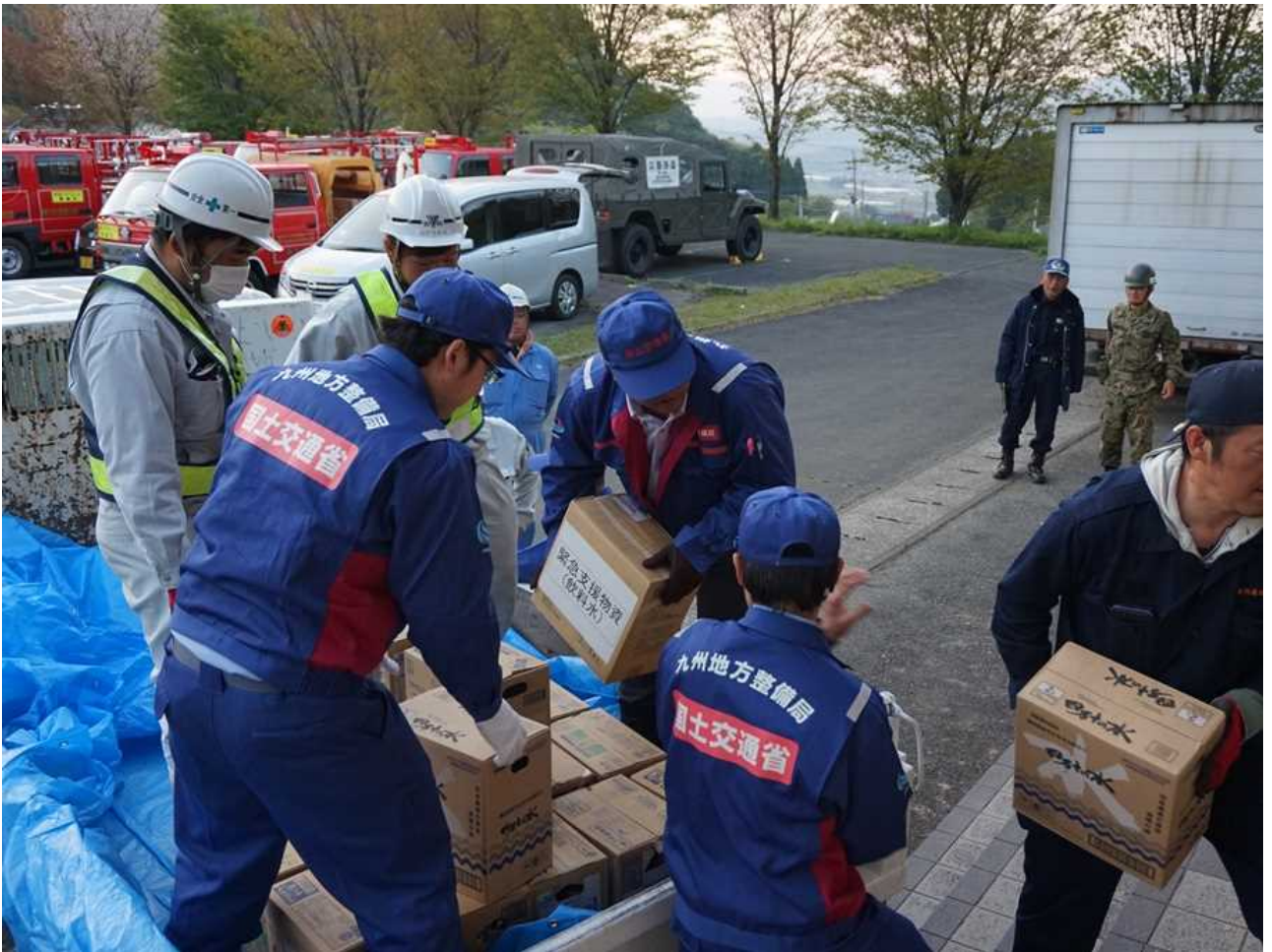
20日(水) 12:30 熊本県南阿蘇村 久木野中学校へ搬入される支援物資