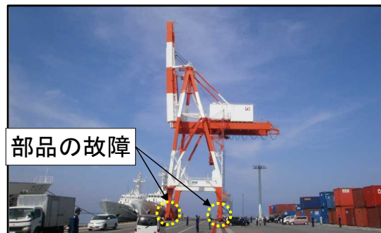
ガントリークレーンの部品の故障箇所