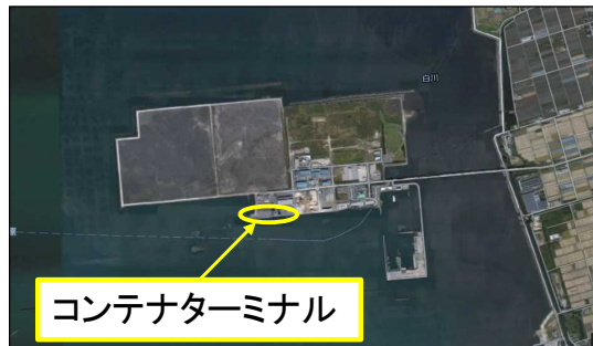
熊本港及びコンテナターミナルの位置図