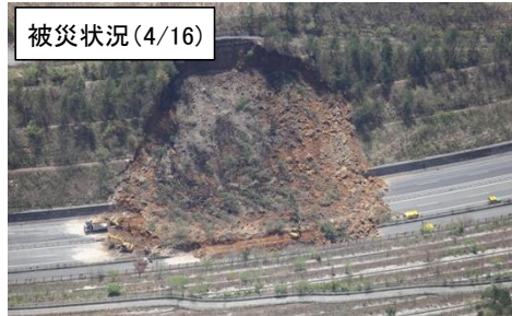
ゆふだけ 由布岳PA付近 土砂崩落