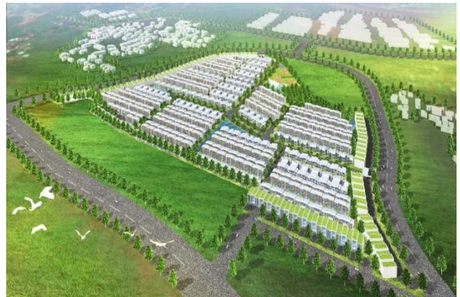
事業対象地イメージパース