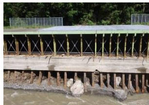
< ⑩ 清瀬覆道損傷 >