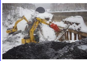
覆道下部工撤去作業