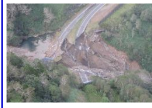
< ㊹ 帯広側8号目付近盛土崩壊 >