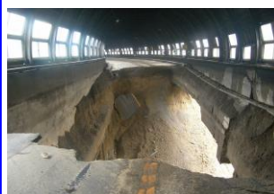
< ㊸ 三国の沢覆道損傷 >