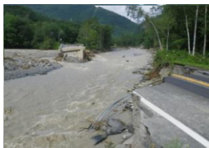
< ⑦ 岩瀬橋落橋 >