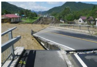
< ① 千呂露橋落橋 >