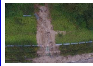
< ㊺ 切土崩壊 >