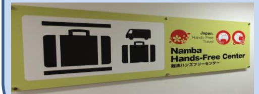
多言語で場所を案内する看板