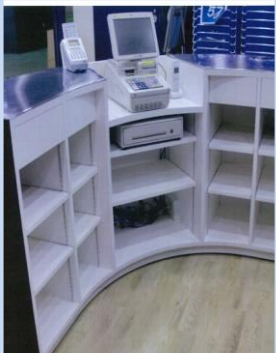
受付業務を行う カウンター設備