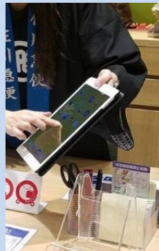
受付業務を補助する タブレット