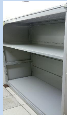
荷物を一時保管するラック