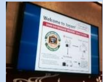
手ぶら観光情報を発信する デジタルサイネージ