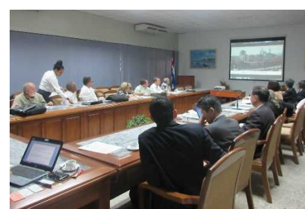
⑥ <関係省庁との意見交換会>