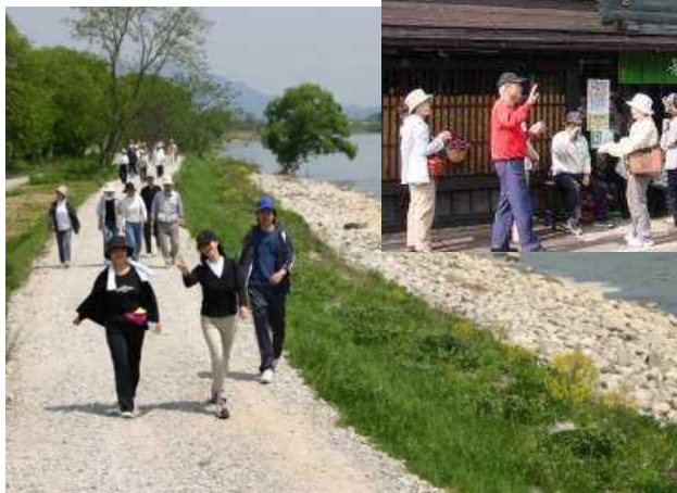
管理用通路をフットパスとして活用（最上川）