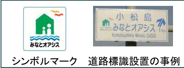
シンボルマーク 道路標識設置の事例