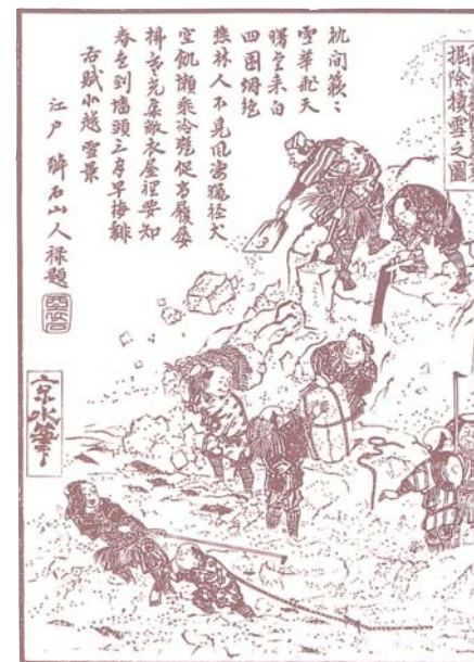
初編巻の上「駅中積雪之図」