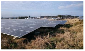
周辺環境と調和した景観形成に必要な太陽光発電施設