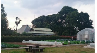
良好な都市環境の形成に寄与する屋敷林と農地