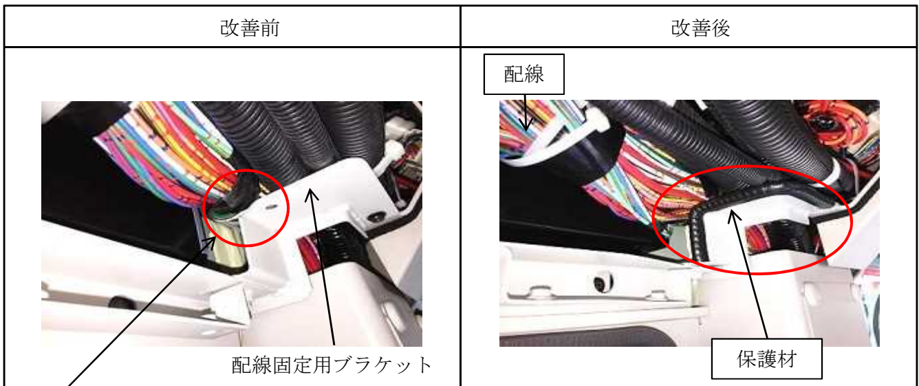
基準不適合発生箇所

大型路線バスにおいて、運転者席上側配電箱内の配線の配索が不適切なため、配線が固定用ブラケットの端部と干渉するものがある。そのため、そのまま使用を続けると、配線の被覆が損傷して短絡し、最悪の場合、扉が開閉できなくなるおそれがある。