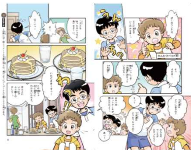
子どもが大好きなウチをストーリーに組み込み 好奇心をくすぐる構成に