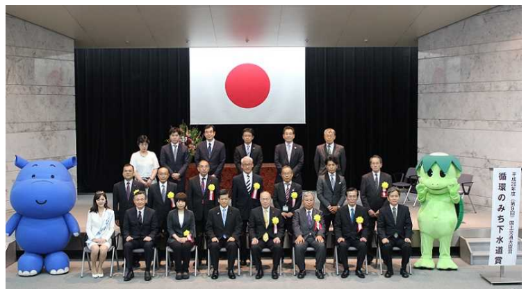
昨年度の受賞式の様子