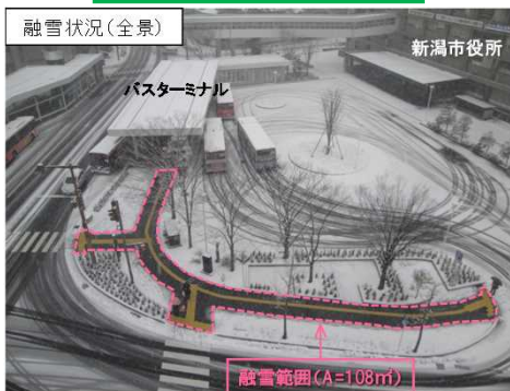
下水熱を利用した歩道融雪(新潟市)