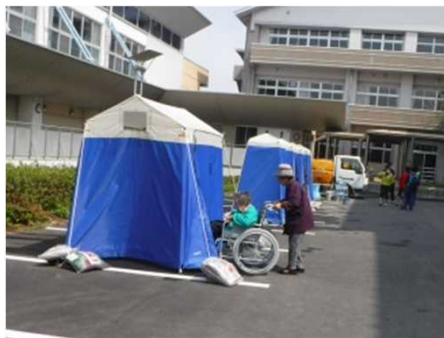
熊本地震におけるマンホールトイレの活用 （熊本市）