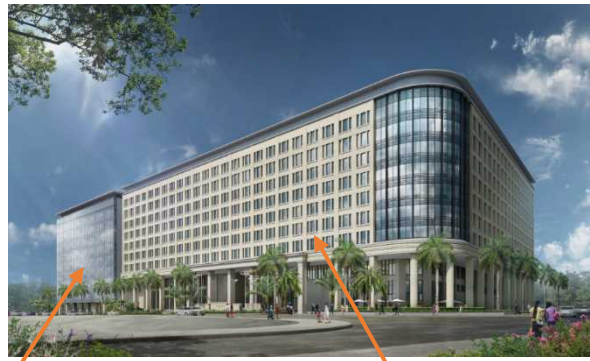
オフィス(1~9 階) ホテル(1~9 階)・商業施設(1 階)

(問い合わせ先) 国土交通省 代表電話番号 03-5253-8111 ●JOIN・認可について 総合政策局 海外プロジェクト推進課 杉田 TEL : 03-5253-8315(内線 25805) FAX : 03-5253-1562 国際政策課 尾崎 TEL : 03-5253-8319(内線 25903) FAX : 03-5253-1561 ●都市開発事業について 都市局 総務課国際室 城山 TEL : 03-5253-8955(内線 32145) FAX : 03-5253-1584