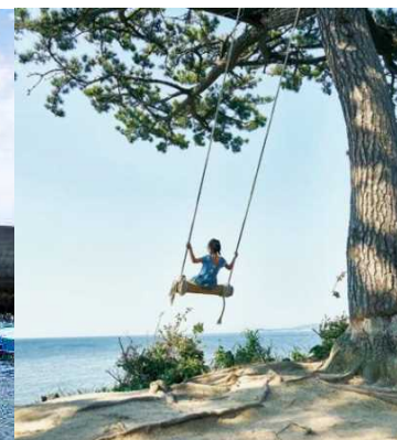
ハイジのブランコ