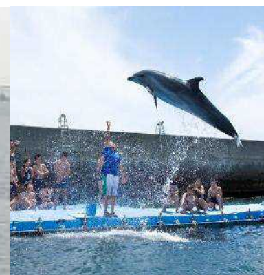
ドルフィンビーチ