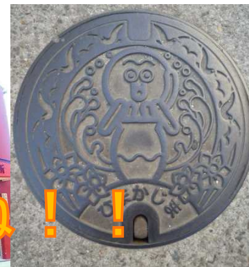
島のマンホール【タコ】のデザイン