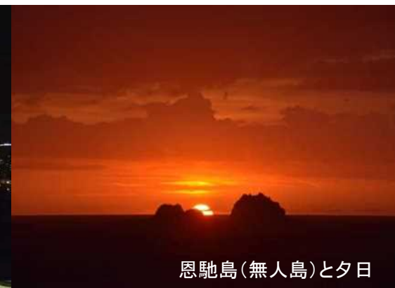
恩馳島(無人島)と夕日