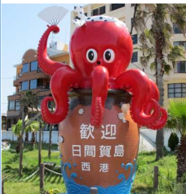
西港 タコのモニュメント【にっしー】