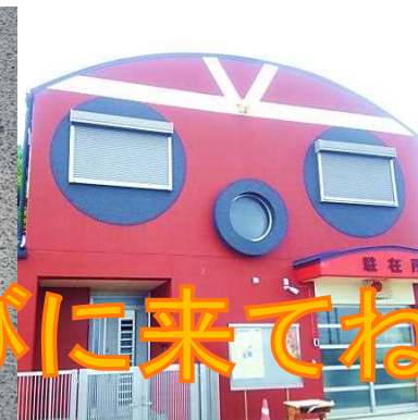
島の駐在所(ちゅうざいしょ) タコのデザイン