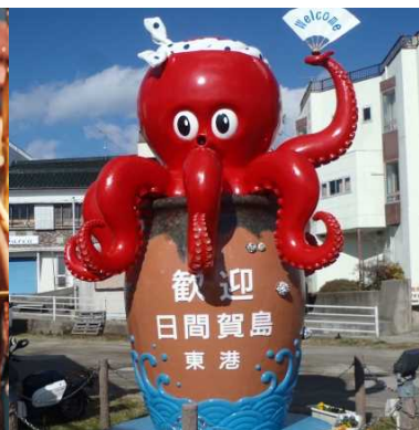
東港 タコのモニュメント【がっしー】