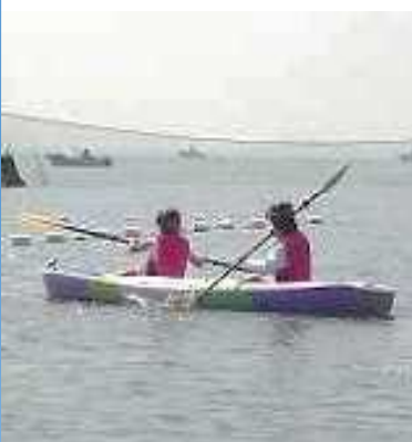
キッズアドベンチャー