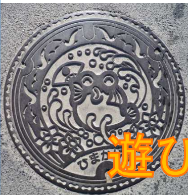
島のマンホール【フグ】のデザイン