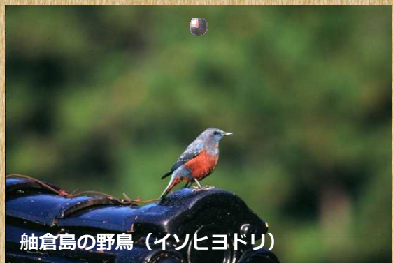
舢倉島の野鳥 (イソヒヨドリ)

輪島から北方約50kmに位置する、標高約12m、周囲約5kmの「絶海の孤島」です。 豊かな自然と貴重な動植物がたくさんあります。