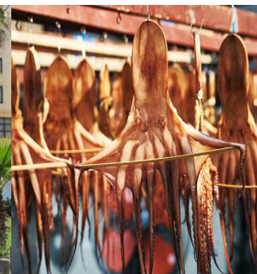
ひものになったタコ