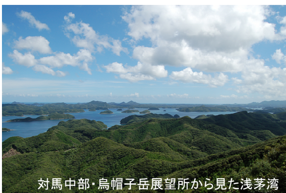
対馬中部・烏帽子岳展望所から見た浅茅湾