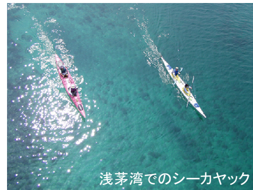
浅茅湾でのシーカヤック

対馬の中央に広がる浅茅湾(あそうわん)は、複雑な入り江と無数の無人島で構成される巨大な内海であり、その穏やかな海面は絶好のシーカヤックフィールドとして最高で、海拔0mからの景色が堪能できます。