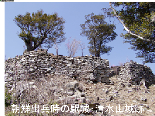
朝鮮出兵時の駅城・清水山城跡

島内には、「日本遺産」(平成27年4月認定)を構成する文化財等が点在し、島内各所で対馬の歴史を感じることが出来ます。