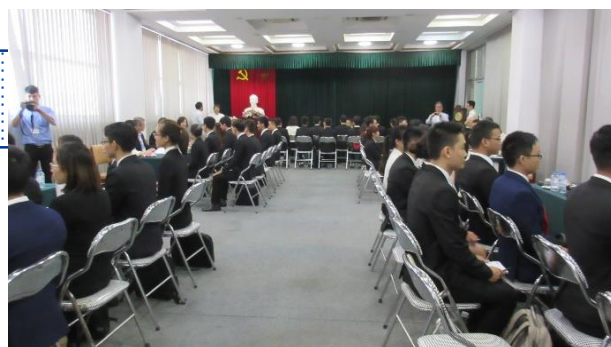
*写真はイメージであり、実際のものとは異なります

参加企業各社が専用ブースを構え、そこを訪れる学生に対して会社紹介や面接などを行う ジョブフェア形式 で進行します。ベトナムの大学等との連携により、意欲ある学生が多数参加します。説明会等を通じて、その中から有望な学生との交流をしていただきます。