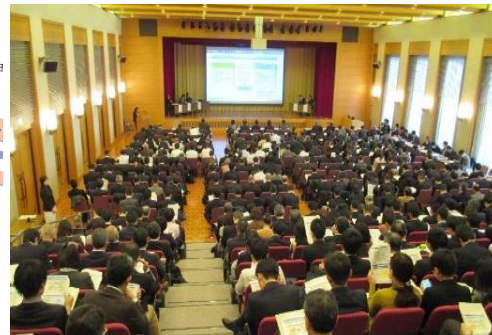
【平成28年度コンセッション事業推進セミナー 開催の様子】