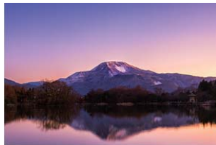
● 三島池 (日本遺産)