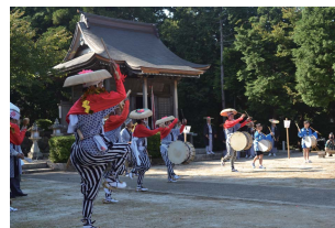
● 朝日豊年太鼓踊 (日本遺産)