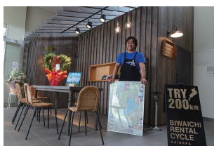
● 米原駅サイクルステーション