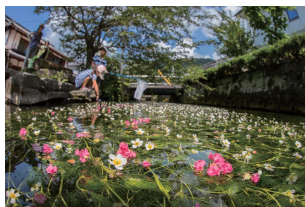
● 醒井宿 (日本遺産) の梅花藻