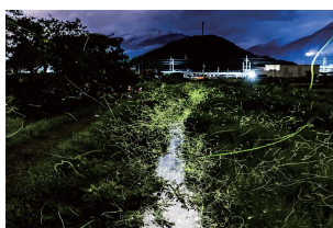
● 長岡のゲンジボタル