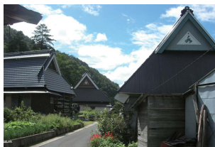
● 東草野の山村風景 (日本遺産)