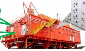
電気系統の統合制御設備