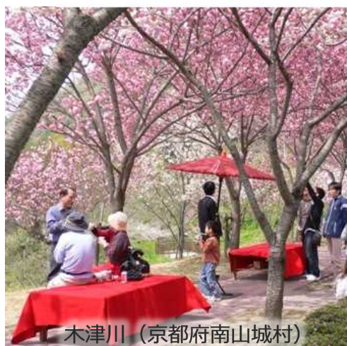
木津川 (京都府南山城村)