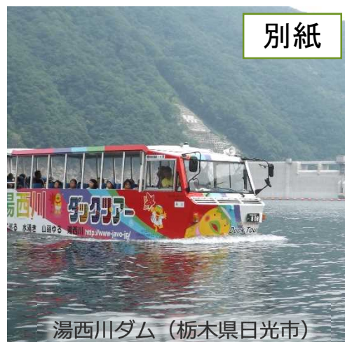
湯西川ダム (栃木県日光市)