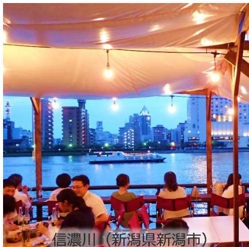
信濃川 (新潟県新潟市)