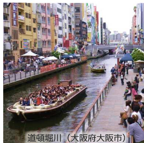
道頓堀川 (大阪府大阪市)