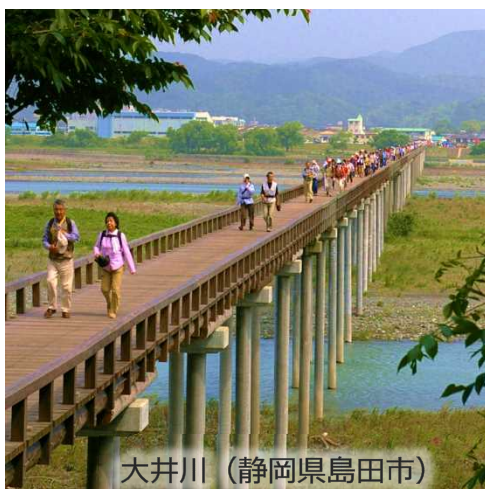
大井川 (静岡県島田市)