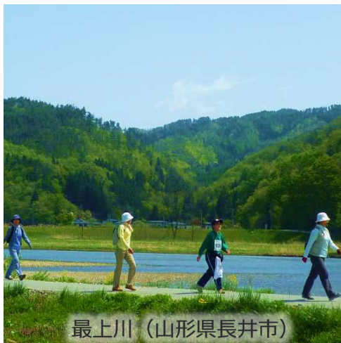
最上川 (山形県長井市)