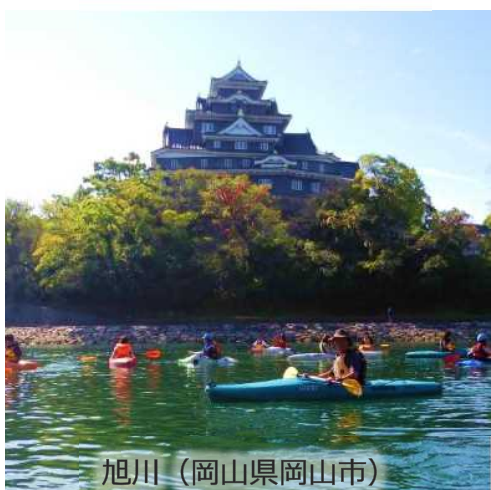
旭川 (岡山県岡山市)