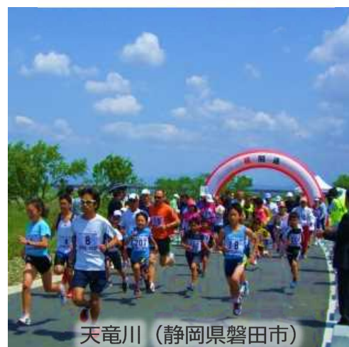
天竜川 (静岡県磐田市)