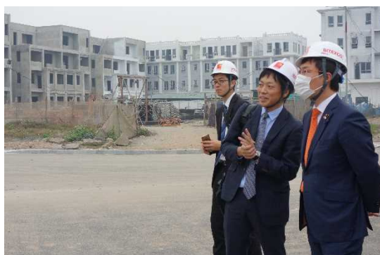
マナーセントラルパークプロジェクト