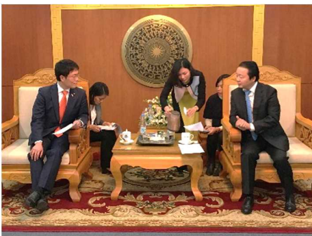
ハー天然資源・環境大臣との会談

土地評価等の土地関連分野及び地図・測量分野において、ベトナムからの視察・研修の受け入れやセミナーの開催等、これまでの両国の協力内容について確認するとともに、今後のさらなる協力関係の強化について意見が一致した。