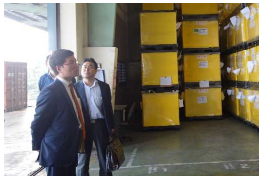
タンロン工業団地内の物流施設