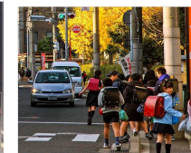
電柱により通学児童が車道にはみ出す