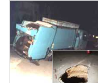
下水道の老朽化による道路陥没