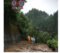
災害により通行できなくなった道路