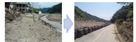
災害時の道路啓開