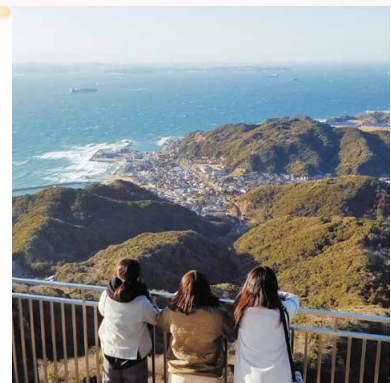
房総半島(鋸南町 鋸山)

主催／国土交通省 運営／株式会社JTB総合研究所 協力／静岡県 下田市 南伊豆町 千葉県 南房総市 館山市 鋸南町 三重県 伊勢市 鳥羽市 Special Thanks / @sorayuchi @_hikari @yuriexx67