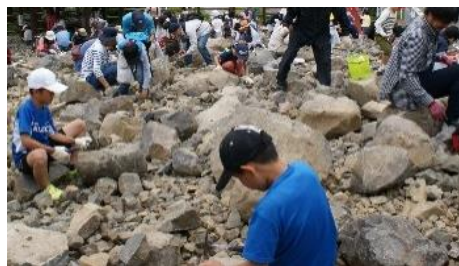
49.熊本県 天草市 御所浦島 ゴールデンウィーク化石教室 (4/28~4/30、5/3~5/6)