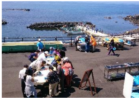
1.北海道利尻町・利尻島 島の魅力を五感で感じる「うにとり体験」と「昆布お土産作り体験」