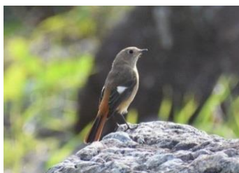
27.山口県萩市見島 日本屈指のバードウォッチングスポット。約350種類の渡り鳥が確認されている