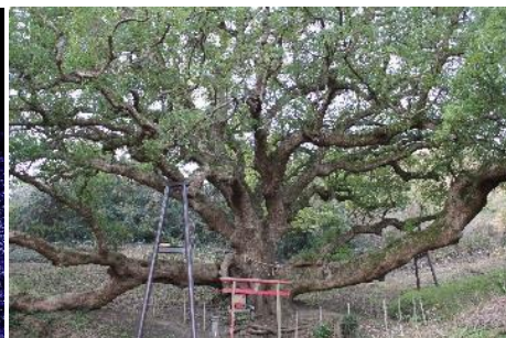
33.香川県三豊市志々島(塩飽諸島) 志々島の大きくす