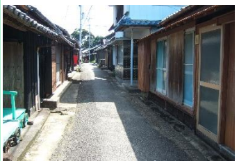
29.徳島県牟岐町出羽島 ガイドの説明を受けながらレトロアイランド出羽島を散策