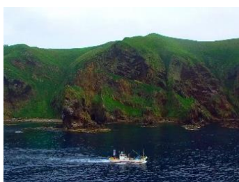
3.北海道羽幌町天売島 漁師さんのガイドで島を一周