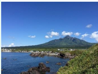
1.北海道利尻町・利尻島 一周55kmの島を一回りし、初夏の利尻を満喫