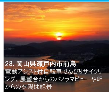
23.岡山県瀬戸内市前島 電動アシスト付自転車でんびりサイクリ ング。展望台からのパノラマビューや岬 からの夕陽は絶景