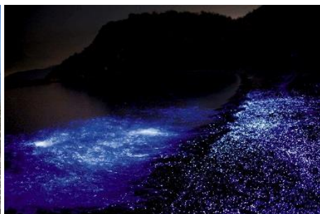
32.香川県三豊市粟島(塩飽諸島) 海ほたる鑑賞(6月頃から)