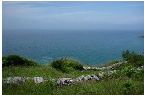
5.宮城県石巻市田代島 ゆったりとした時間の中で自然を満喫