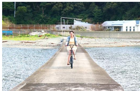
39.愛媛県八幡浜市大島(宇和海諸島) レンタサイクル(1回200円)で島めぐり