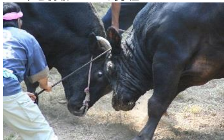
17.島根県隠岐の島町島後(隠岐諸島) 「隠岐牛突き」日本最古約800年の歴史(随時)