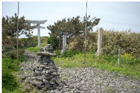
11.石川県輪島市舳倉島 絶景 遺跡や神社も多く北西岸の複雑な 入り江は好景観