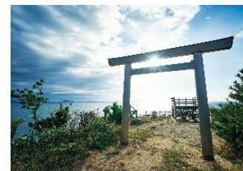
13.愛知県南知多町篠島 きらきら展望台は恋人の聖地に認定の注目スポット