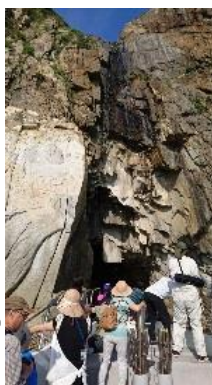
40.高知県宿毛市 沖の島・鞆来島

「海辺のワイルドレ ストラ」 漁見学、海BBQ、 スターウォッチング、 ウォーキング (5月中旬予定)