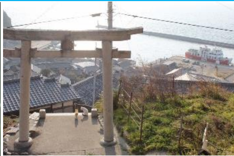
30.香川県高松市男木島 豊玉姫神社 から臨む石垣の集落と瀬戸内海の絶景