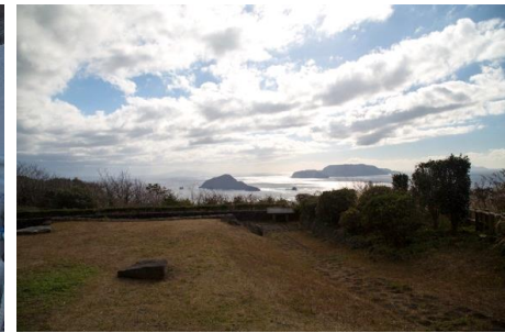
8.東京都利島村利島(伊豆諸島) 新東京百景「南ヶ山展望台」