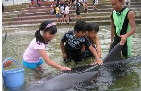
12.愛知県南知多町日間賀島 子どもが主役のイベント「キッズアドベンチャー」で大自然を楽しもう！イルカドルフィンビーチでは、イルカと触れ合えます