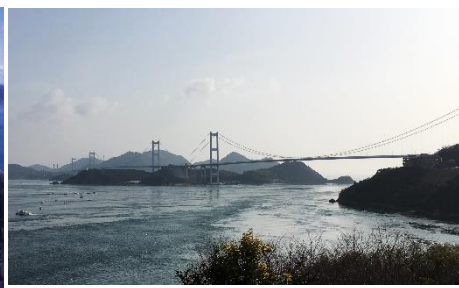
37.愛媛県今治市来島 城跡の頂上から来島海峡大橋を一望 できる。