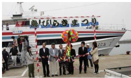
27.山口県萩市見島 「島びらきまつり」を開催。見島の特産品 や伝統文化が楽しめます(5/3)