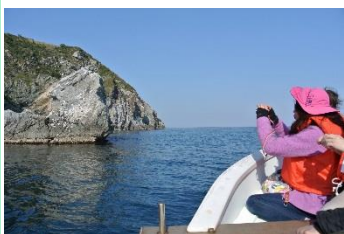
15.兵庫県南あわじ市 沼島 沼島おのころクルーズは、沼島の周囲10キロを漁船で巡ります