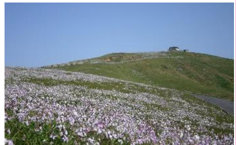
20.島根県知夫村知夫里島(隠岐諸島) 一面に咲く野大根の季節に行われる「野大根祭り」(4/21)