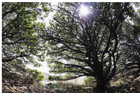
2.北海道羽幌町焼尻島 強風と豪雪に耐える「地を這う森」