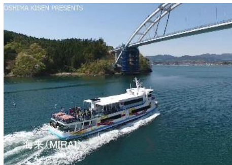
4.宮城県気仙沼市大島 大島と開通間近の気仙沼大島大橋を眺めるベイクルーズ(4/28~5/6:期間中毎日4便運航)