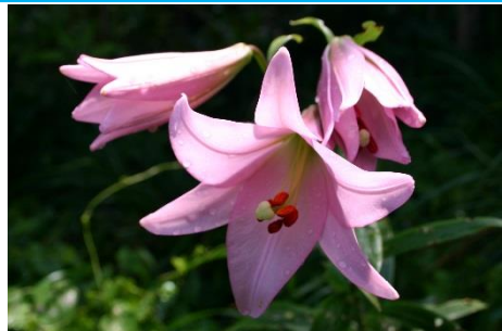
28.徳島県阿南市伊島 「イシマササユリ」 淡いピンクの優雅な花を咲かせています