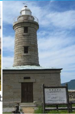
30.香川県 高松市男木島