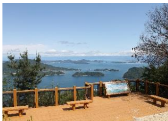
24.広島県大崎上島町大崎上島 大崎上島の最高峰「神峰山」へのウォーキング (5月第3日曜)