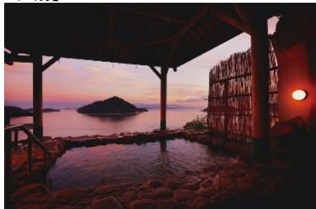
24.広島県大崎上島町大崎上島 「きのえ温泉」眼前に広がる瀬戸内海の大 パノラマを堪能しながら、ゆったり温泉で癒す