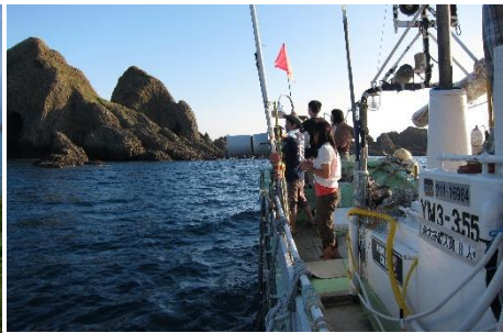
6.山形県酒田市飛鳥 大迫力のクルージングをお楽しみ下さい