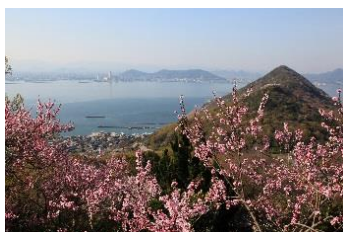
31.香川県高松市女木島 瀬戸内の風を感じる女木島ウォーキング