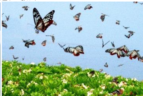
50.大分県姫島村姫島 優雅に空を舞うアサギマダラ (5月上旬～6月上旬頃)