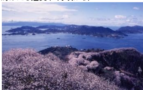
35.愛媛県上島町岩城島 積善山3,000本桜 いわぎ桜まつりメインイベントを開催(4/8)