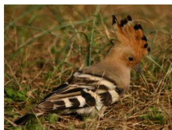
6.山形県酒田市飛島 バードウォッチングの聖地飛島をお楽しみ下さい