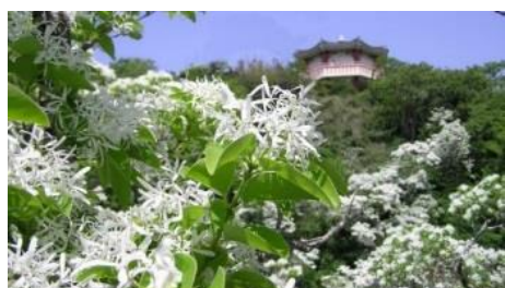
42.長崎県対馬市対馬島鰐浦地区 山一面に広がるヒツバタゴ(5月初旬)