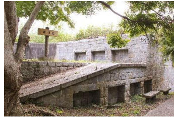
36.愛媛県今治市小島 島内に点在する要塞跡を散策することができる