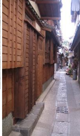
14.三重県鳥羽市答志島