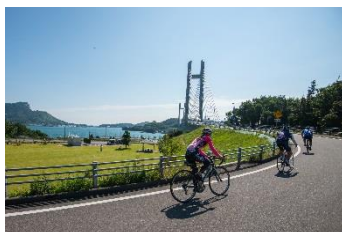
35.愛媛県上島町 ゆめしま海道サイクリング橋から眺める多島美は絶景