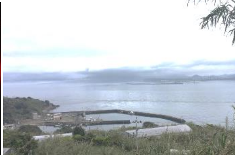
25.山口県下関市六連島(響灘諸島) 頂上部からは下関市街、響灘緑地や 北九州市も見渡せる