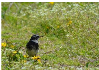
11.石川県輪島市舳倉島 珍しい渡り鳥を目当てに多くのバードウォッチャーが訪れる