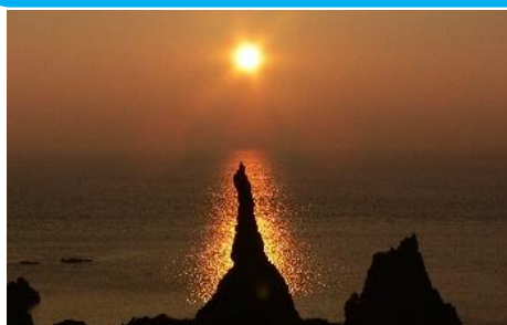
19.島根県西ノ島町西ノ島(隠岐諸島) 日本の夕陽百選「国賀海岸・観音岩の 夕陽」