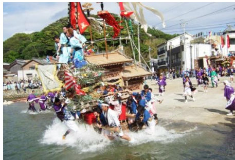
15.兵庫県南あわじ市沼島 沼島八幡神社の春祭りは、沼島水軍を彷彿とさせる勇壮さ