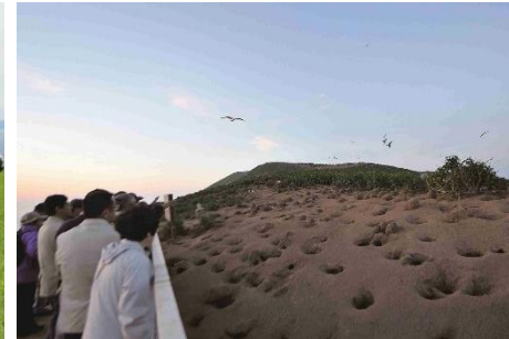
3.北海道羽幌町天売島 初夏には海鳥の子育ても見られる