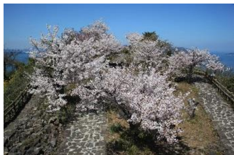
31.香川県高松市女木島 鷲ヶ峰展望 台から望む桜と瀬戸内海の絶景