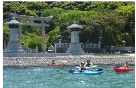
16.兵庫県姫路市家島諸島 カヌーで家島の海を体感(家島B&G海洋センター)