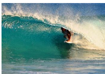
9.東京都新島村新島 (伊豆諸島) 世界に誇れるパワーある波がブレイク