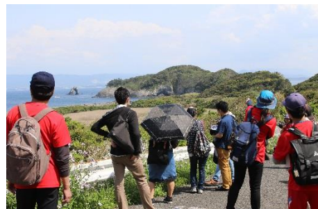
41.福岡県新宮町相島 相島！春フェスタ(4/21)

「海辺のワイルドレ ストラ」 漁見学、海BBQ、 スターウォッチング、 ウォーキング (5月中旬予定)