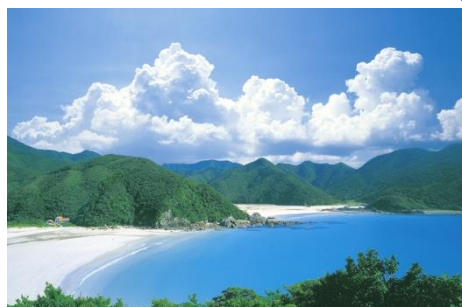
45.長崎県五島市福江島、久賀島、 奈留島ほか(五島列島) 日本の灯台50選「大瀬崎灯台」、 渚100選「高浜海水浴場」