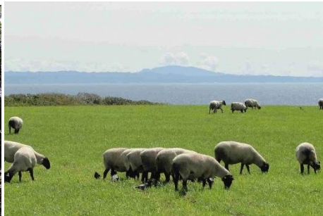
2.北海道羽幌町焼尻島 かわいい羊に会いこいこう