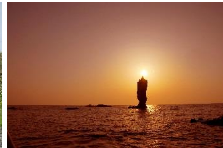
17.島根県隠岐の島町島後(隠岐諸島) 自然が創り出した神秘の絶景 「ローソク島」