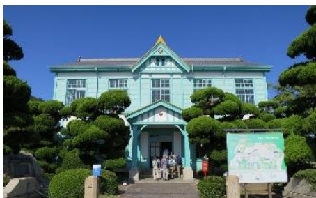
32.香川県三豊市栗島(塩飽諸島) 島四国88ヶ所めぐり(4/29)