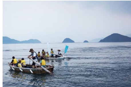
49.熊本県 天草市 御所浦島・牧島・ 横浦島 御所浦ぐるっと一周クルージ ング、伝馬船(てんません)櫓漕ぎ体験