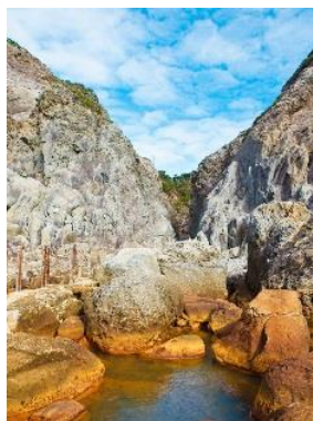
9.東京都 新島村 式根島 (伊豆諸島) 鉦(なた)で 割ったような 地形の絶景 温泉