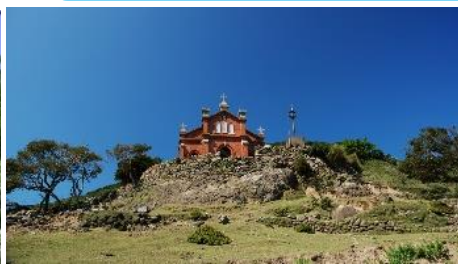
44.長崎県小値賀町小値賀島 鉄川与助によって設計・施工されたレンガ 造りの教会