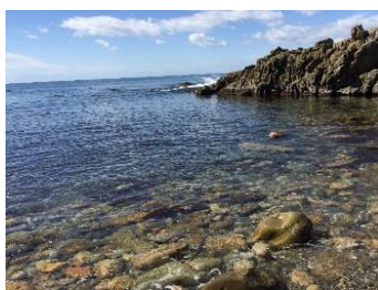
5.宮城県石巻市田代島 三陸沖の好漁場で、釣りが楽しめます