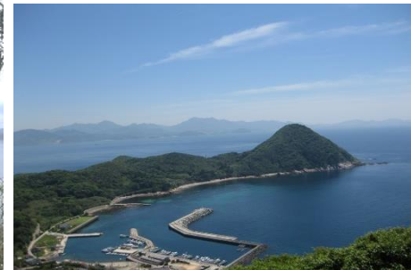
26.山口県下関市蓋井島(響灘諸島) 乞月山から蓋井島漁港、響灘を一望 できる