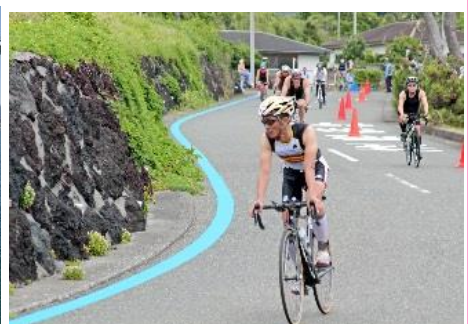
7.東京都大島町大島(伊豆諸島) 伊豆大島トライアスロン大会今年で30回を迎える(6/9)