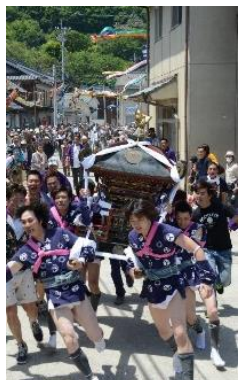
22.岡山県笠岡市笠岡諸島