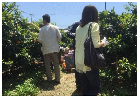
38.愛媛県松山市中島(忽那諸島) 日本一のカラマンダリンの収穫de愛イベント 高級柑橘の収穫体験&海の幸を堪能しな がら新しい出会いを。(女性限定)