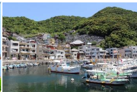
51.大分県津久見市保戸島(豊後諸島) 地中海を連想させる独特の景観 島の山道を登ると眼下に広がる豊後水道