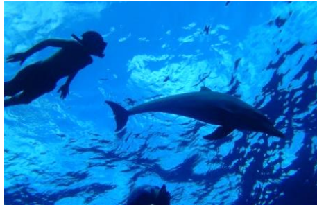
10.東京都御蔵島(伊豆諸島) 凧(なぎ)なら、ほぼ100%、野生のイルカと泳げます。