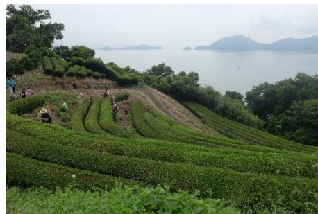
38.愛媛県松山市中島(忽那諸島) 茶摘み体験としまのわ紅茶づくり しまで育ったべにふうき茶葉の茶摘みと 紅茶づくり体験