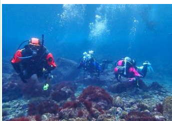
7.東京都大島町大島 (伊豆諸島) 大島のシンボル三原山登山ハイキング 自然豊かな海で体験ダイビング