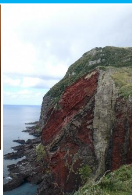
20.島根県 知夫村 知夫里島 (隠岐諸島) 色鮮やかな 大岩壁 「赤壁」