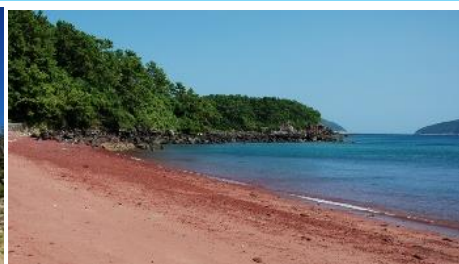
44.長崎県小値賀町小値賀島 砂も砂利も赤く、とても珍しい赤浜海岸