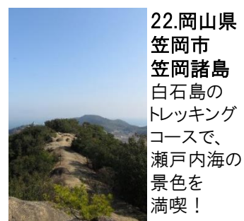
22.岡山県笠岡市笠岡諸島 白石島のトレッキングコースで、瀬戸内海の景色を満喫！