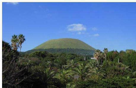
45.長崎県五島市福江島、久賀島、奈留 島ほか(五島列島) 福江島のシンボル 「鬼岳」にてバラモン凧揚げ大会開催