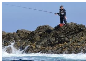
28.徳島県阿南市伊島 無数の荒磯があり、磯釣りが楽しめる