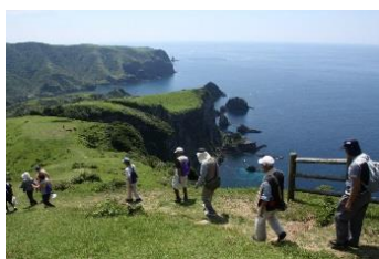
19.島根県西ノ島町西ノ島 (隠岐諸島) 絶景257mの大断崖を望む「摩天崖遊歩道トレッキング」