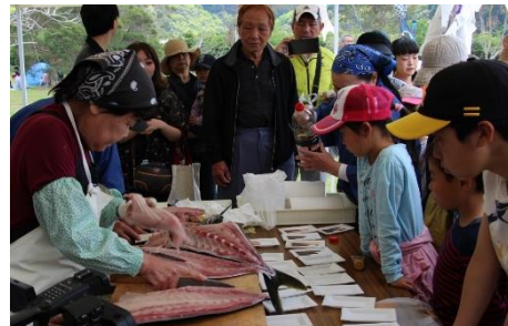
52.大分県佐伯市大入島 第11回 おおにゅうじま島まつり