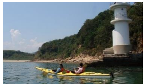
23.岡山県瀬戸内市前島 シーカヤックで穏やかな瀬戸内海の小島美を楽しめます。運が良ければ小型のクジラ・スナメリに出会えるかも