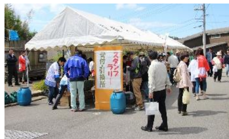
34.香川県小豆島町・小豆島 醬の郷(ひしおのさと)まつりを開催 (4/28)