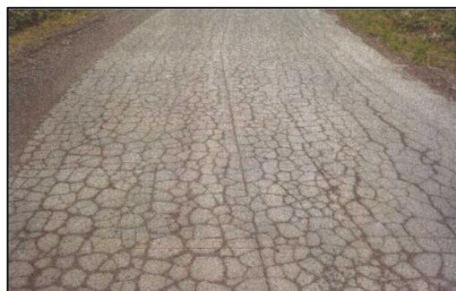
路面の亀甲状クラック