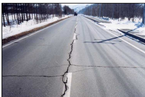
凍上によるひび割れ

(※) 凍上災(とうじょうさい)とは、冬期の低温によって道路の路盤(ろばん)等に大きな霜柱が発生し地面が隆起する等の凍上現象により道路舗装にひび割れなどが発生する災害です。