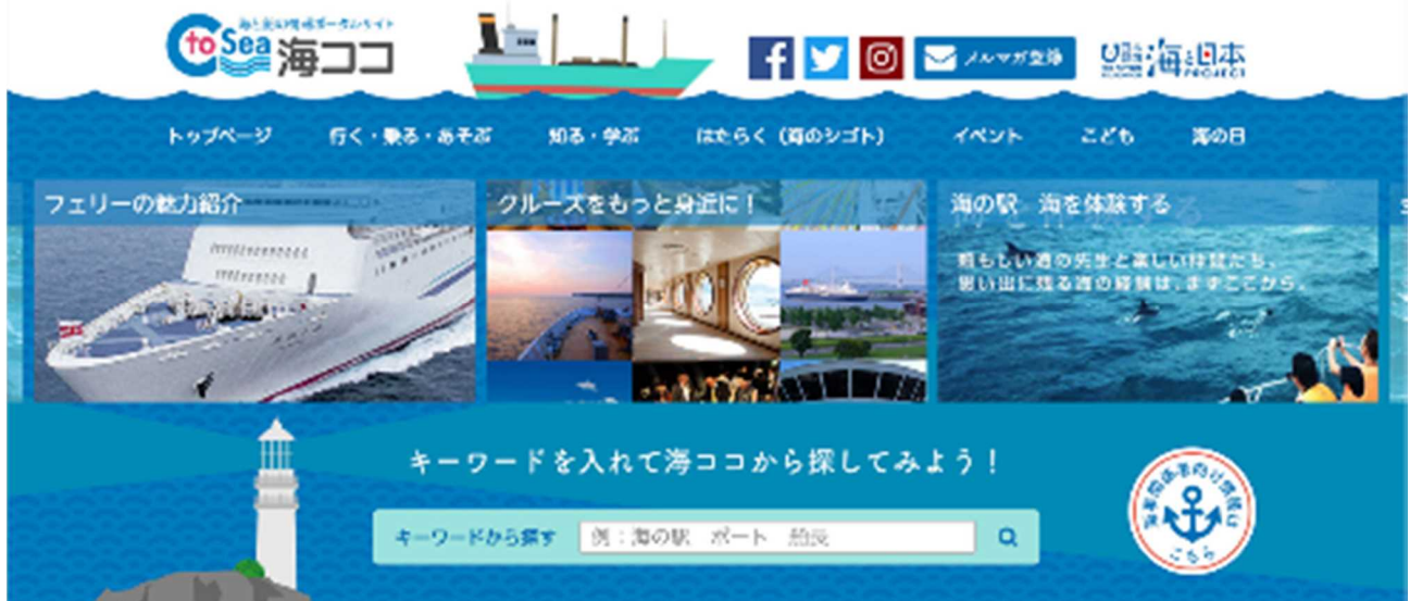
▲ポータルサイト「海ココ」トップページ (イメージ)

※ポータルサイト「海ココ」及び専用 SNS は4月26日0時からアクセスできます。