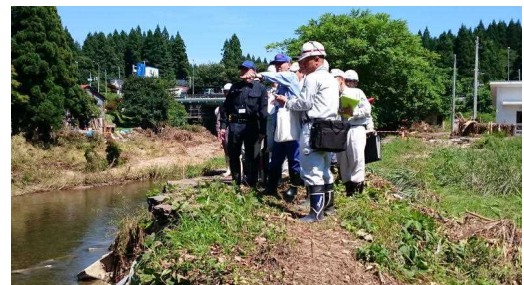
H29. 8秋田県内での災害緊急調査の状況写真