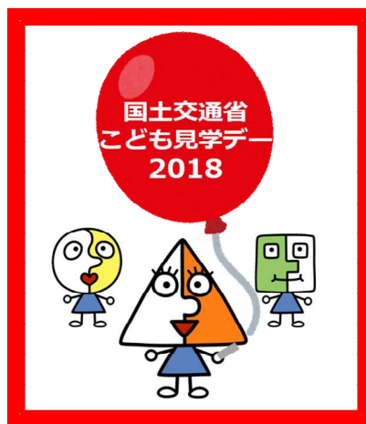
(2018年度シンボルマーク)

国土交通省は、『知的好奇心、スイッチオン!!』をテーマに過去最多の42個のプログラムを3つのエリアゾーンで展開するなど、国土交通省の様々なお仕事を、テーマパークで遊ぶように楽しく体験してもらえる工夫を盛り込み、こども見学デーを開催します。