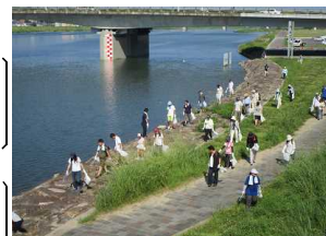
河川周辺の清掃活動

7月1日から7日までを「河川水難事故防止週間」と定め、出前講座等により水難事故防止に関する啓発活動を行います。