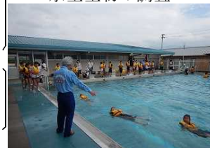
水難事故防止講座