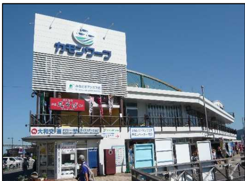
構成施設のイメージ