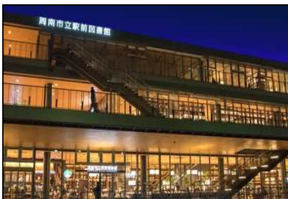
徳山駅前賑わい交流施設