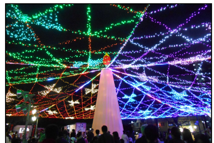
周南冬のツリーまつり

※ 「みなとオアシス」の関連情報については、下記 URL からご覧いただけます。