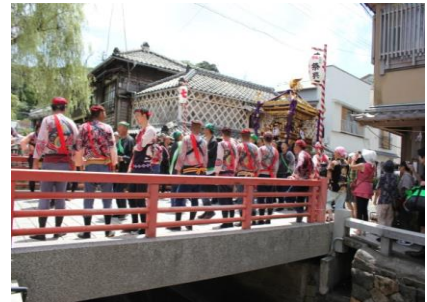
【下田八幡神社例大祭】

国指定史跡「了仙寺」や「玉泉寺」及びその周辺地域と、開国の舞台となった湊町における下田八幡神社例大祭、日米親善と交流を広げる黒船祭等からなる歴史的風致の維持向上を図るため、伊豆石やなまこ壁造りの歴史的建造物の保存修理や、了仙寺周辺の無電柱化や道路の美装化による修復整備、祭りで使用する道具の整備・補修に関する支援等の事業等が位置づけられています。