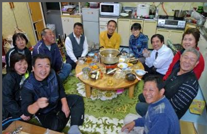
様々な取組が生まれる「キッチン会議」