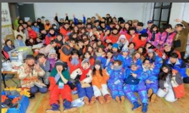
海外からも参加する多数のボランティア

厳寒地の冬の夜という、従来では観光資源として考えられなかった要素に注目し、寒いからこそ感じられる北の旅愁、人の温もりを伝える「静のイベント」として、延べ12万本のキャンドルの灯りが歴史的遺産である小樽運河など街の夜を演出するイベントを開催。