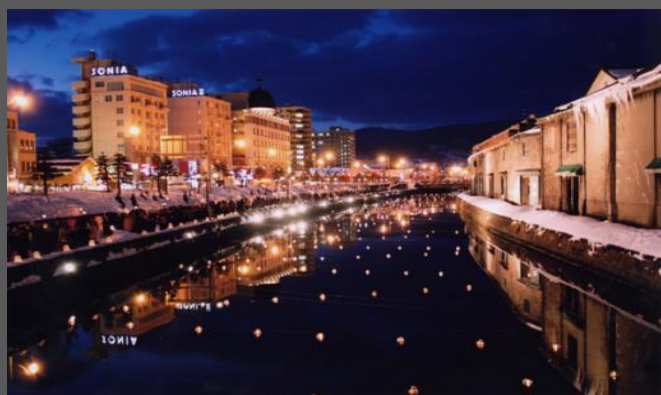
小樽雪あかりの路小樽運河会場