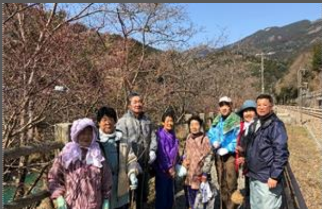
大歩危駅の桜の植樹

平成22年10月に無人化されたJR大歩危駅に賑わいを取り戻そうと、同年11月に協議会を設立。地域の方が意見交換する「キッチン会議」で様々なアイデアを出し合い、駅構内や周辺の清掃活動や桜の苗の植樹、桜のライトアップ等を行っている。また駅事務所を休憩所兼観光案内所に改装したほか、観光情報が入手できるよう、インターネット環境を整備した。駅利用者は、平成22年の約2万5千人から、平成30年には約4万人に増加する見込みであり、活動の結果、駅の利便性の向上や地域の活性化に寄与している。