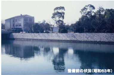
整備前の状況(昭和63年)