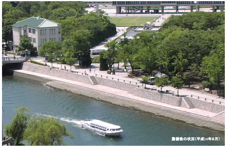
整備後の状況(平成14年8月)

■ 世界遺産原爆ドーム前や平和記念公園を流れる元安川において、親水テラス等の整備により、「水の都ひろしま」にふさわしい風景を創出