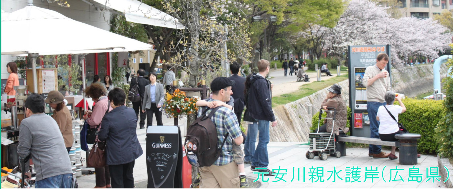
元安川親水護岸(広島県)