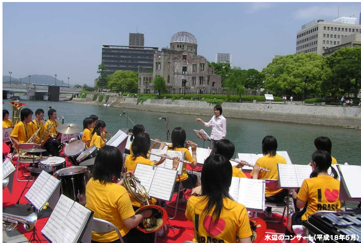
水辺のコンサート(平成18年5月)