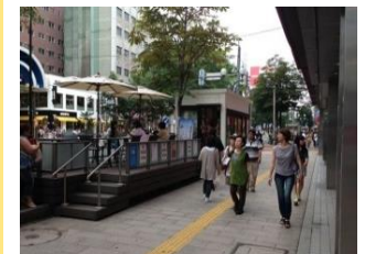
オープンカフェ等の施設の整備等によるまちの賑わい、交流の場の創出(イメージ)