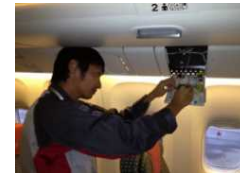
客室内の照明の交換