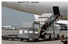
手荷物・貨物の搭降載取扱