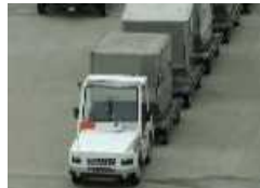
航空機への貨物等の移送