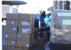
手荷物・貨物取扱