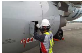
エンジンオイル量の確認