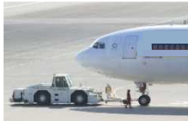
航空機地上走行支援