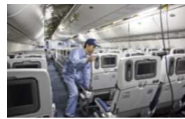
客室内椅子の取付・取外し