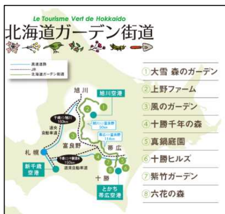
北海道の十勝・上川地域の8庭園が連携し、観光ブランド化に成功した事例