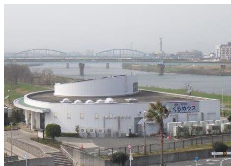
筑後川防災施設「くるめウス」（福岡県）

※国土交通省では、地域活性化のため、インフラをよりご理解いただくためにインフラツーリズムを推進しています。