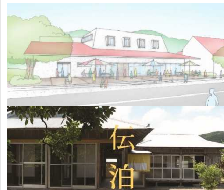
伝統的な建築物を活用した宿泊施設(交流拠点)