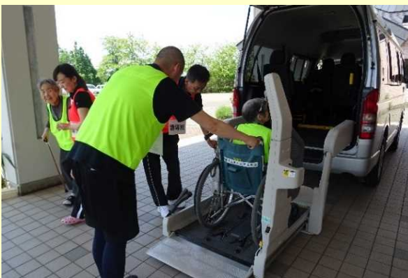
みたねちょう 秋田県三種町 避難行動要支援者 避難状況