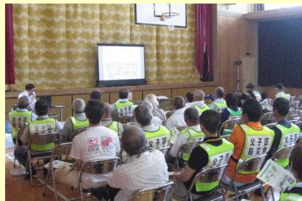
ちょう 福井県おおい町 講師:県土木事務所職員