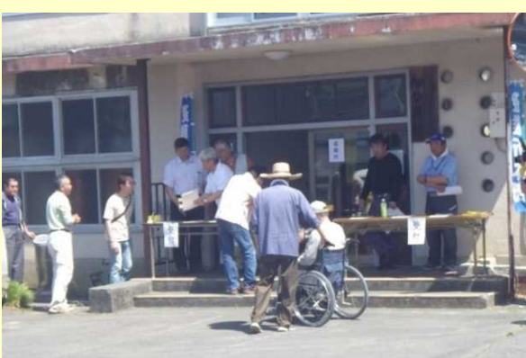
かなみちょう 静岡県函南町 避難行動要支援者 避難状況