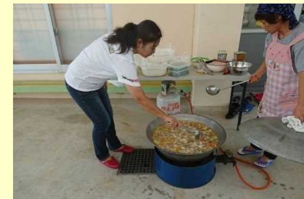
避難所生活体験:北海道室蘭市(泊まりこみ) 炊き出し:新潟県佐渡市、沖縄県うるま市 ほか ドローン調査:福井県おおい町(町所有) など