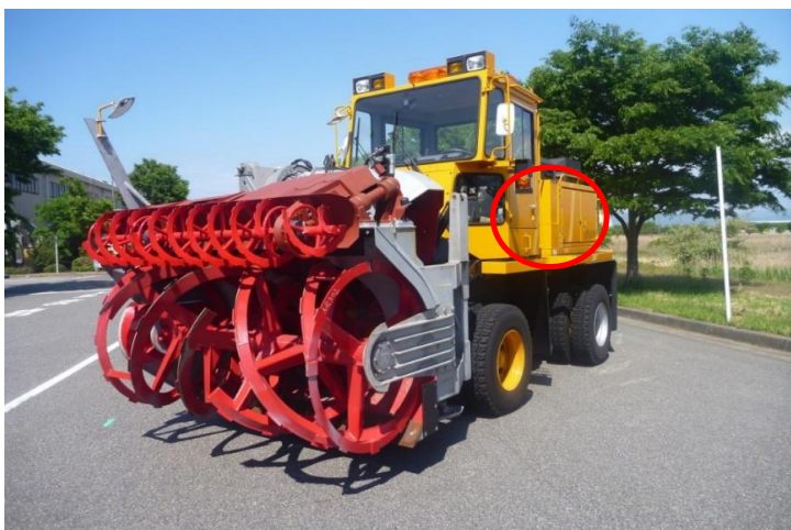
「ニイガタNR302ロータリ除雪車」