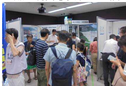
平成30年度 水のワークショップ・展示会の様子