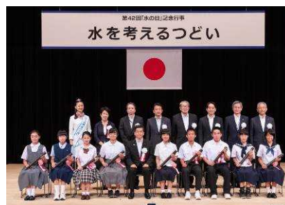
平成30年度 水を考えるつどいの様子