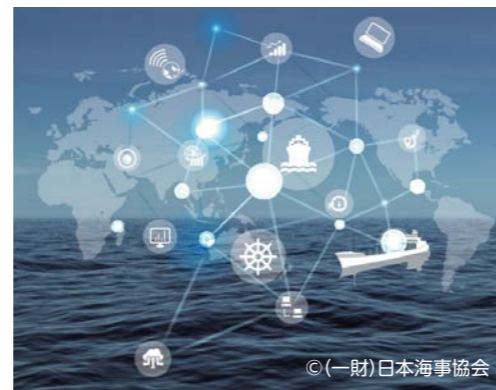
▲海事イノベーションの推進により、新たな価値を創出

ここでは、今後の海事業界に新しい価値やサービスを創出し、大きな革新をもたらすと期待される、国や民間企業による海事イノベーションに関連する最新の取組をご紹介します。