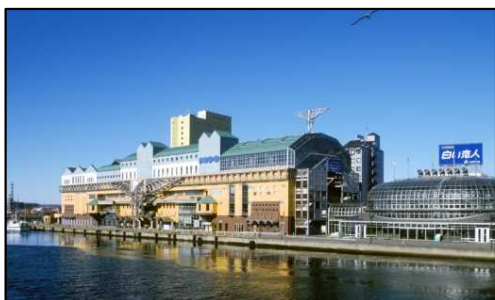
釧路フィッシャーマンズワーフMOO & EGG