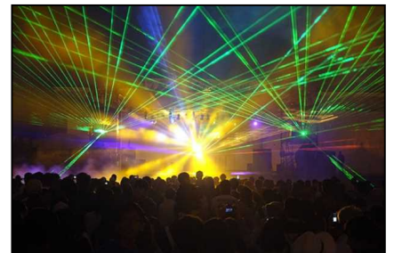
くしろ霧フェスティバル