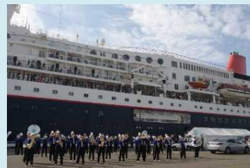
学生によるマーケティング演奏

クルーズ船の寄港時の接岸場所となっており、お出迎え・お見送りのイベント等が実施され、賑わいの場となっている。耐震・旅客船ターミナルとして大規模地震時には、臨海部防災拠点となり、船舶により地域の緊急物資や被災地の復旧のための資機材の受入を行う。