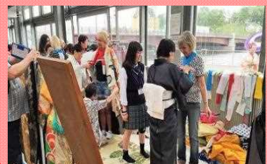
着物の着付け体験

釧路の観光拠点として、年間約70万人の旅行者を受け入れ、水産加工品やお土産などの販売、食堂や軽食喫茶なども営業している。多言語対応の観光案内所を備え、クルーズ船おもてなし時は外国人観光客に対して、着物の着付け体験、書道・茶道体験などの日本文化を通じた交流イベントを開催。