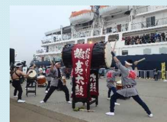
くしろ蝦夷太鼓演奏