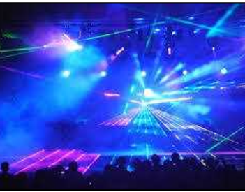
くしろ霧フェスティバル(7月)