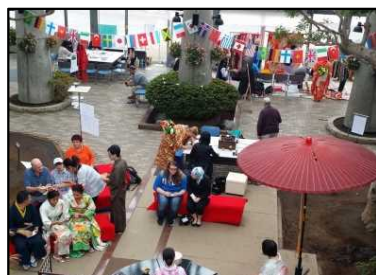
クルーズ船おもてなしイベント（5月～10月）