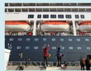
釧路市観光大使 おもてなしソング