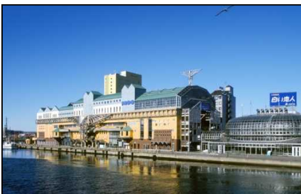
【代表施設】釧路フィッシャーマンズワーフMOO&amp;EGG