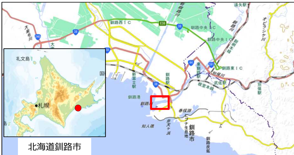
北海道釧路市 国土地理院地図（電子国土Web）( http://maps.gsi.go.jp )をもとに釧路市作成